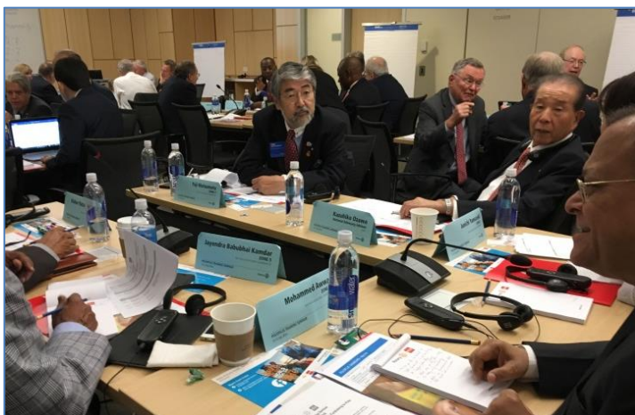
トレーニングセミナーの会場の様子

国際ロータリーの本部の玄関横には経口ポリオワクチンを子供に投与している像も設置されていて道行く人にもロータリーの最優先課題の活動がわかるようになっていました。