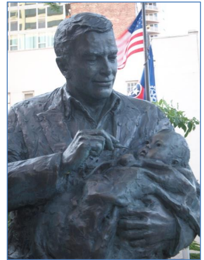
ワクチン投与の像(国際ロータリー本部前)

今年に入ってから患者数が19例とまだ野生株での発生が続いているために、今年のうちに発生が止められても2019年まで撲滅の宣言は出ないことも話されました。出席者からは集められた寄付金の使途についても内容を求められましたが、会議の期間中には概略が説明されただけで十分な理解が得られたような表情ではありませんでした * 。ワクチンの購入費用だけでなくワクチン投与のスタッフの日当やスタッフがボートで投与に向かう時のライフジャケットの購入までもしないと現地ではワクチンが投与できないという現実も知ることができました。