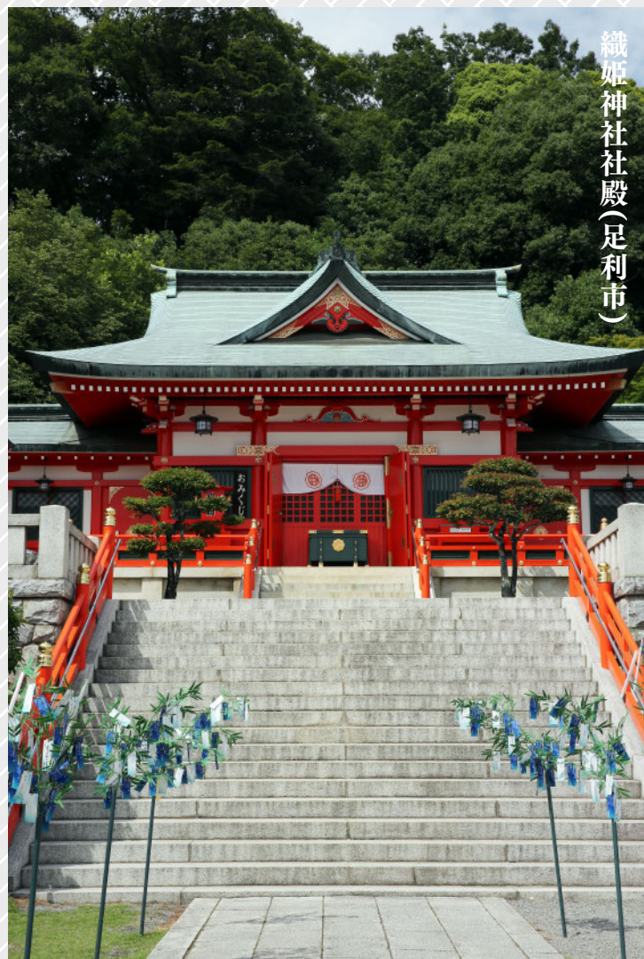
織姫神社社殿(足利市)