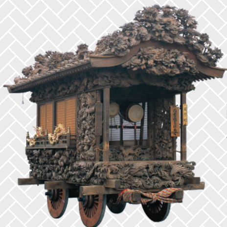
ユネスコ無形文化遺産 国指定重要無形民俗文化財 鹿沼秋まつり彫刻屋台