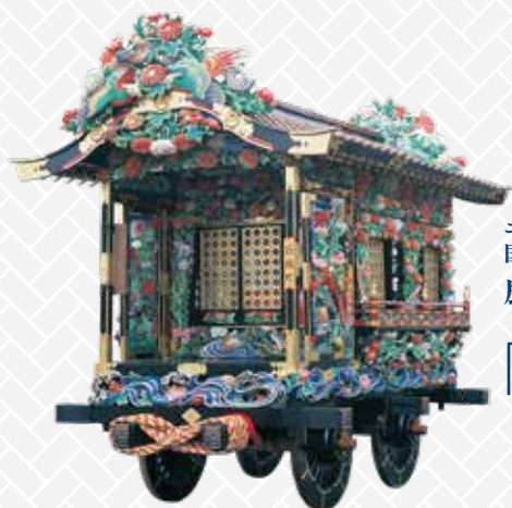
ユネスコ無形文化遺産 国指定重要無形民俗文化財 鹿沼秋まつり彫刻屋台