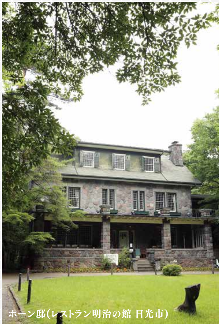
ホーン邸(レストラン明治の館 日光市)