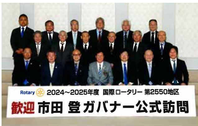
小山東ロータリークラブ 令和6年10月25日(金) 於：小山グランドホテル