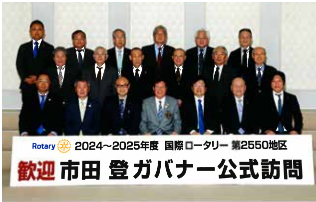
小山東ロータリークラブ 令和6年10月25日(金) 於：小山グランドホテル